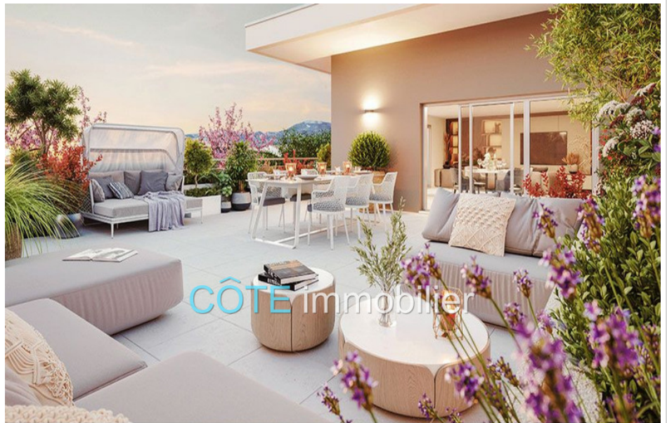
Programme neuf - Convention milancip - MLS Côte d'Azur