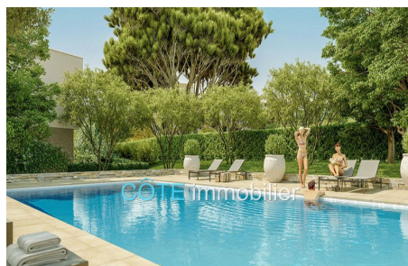
Programme neuf - Convention milancip - MLS Côte d'Azur