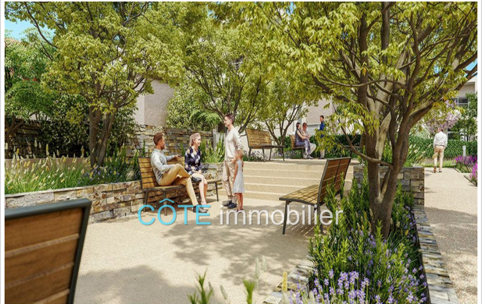
Programme neuf - Convention milancip - MLS Côte d'Azur