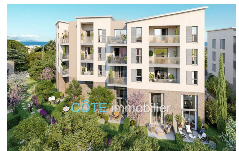
Programme neuf - Convention milancip - MLS Côte d'Azur

Côte Immobilier - 25, avenue Thiers - 06600 Antibes - Juan les Pins Tél. +33(0)4 97 23 96 23 - www.cote-immobilier.fr - info@cote-immobilier.fr